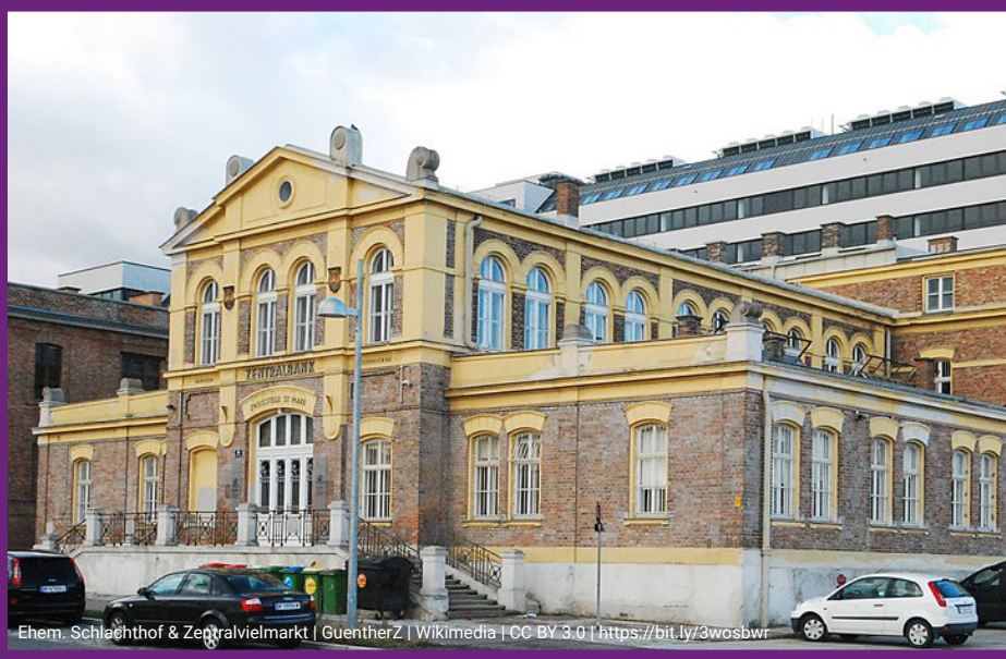
Ehem. Schlachthof & Zentralvielmarkt