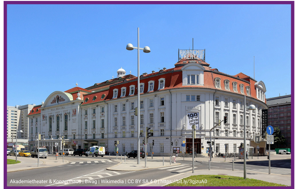
Akademietheater & Konzerthaus