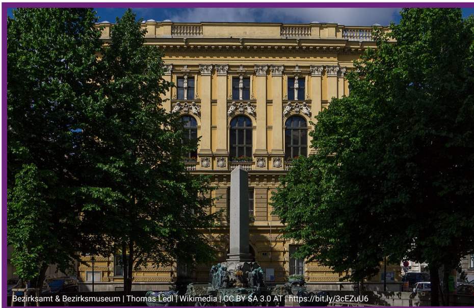
Bezirksamt & Bezirksmuseum | Thomas Ledl | Wikimedia | CC BY SA 3.0 AT | https://bit.ly/3cEZuU6