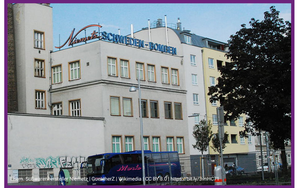
Ehem. Süßwarenhersteller Niemetz